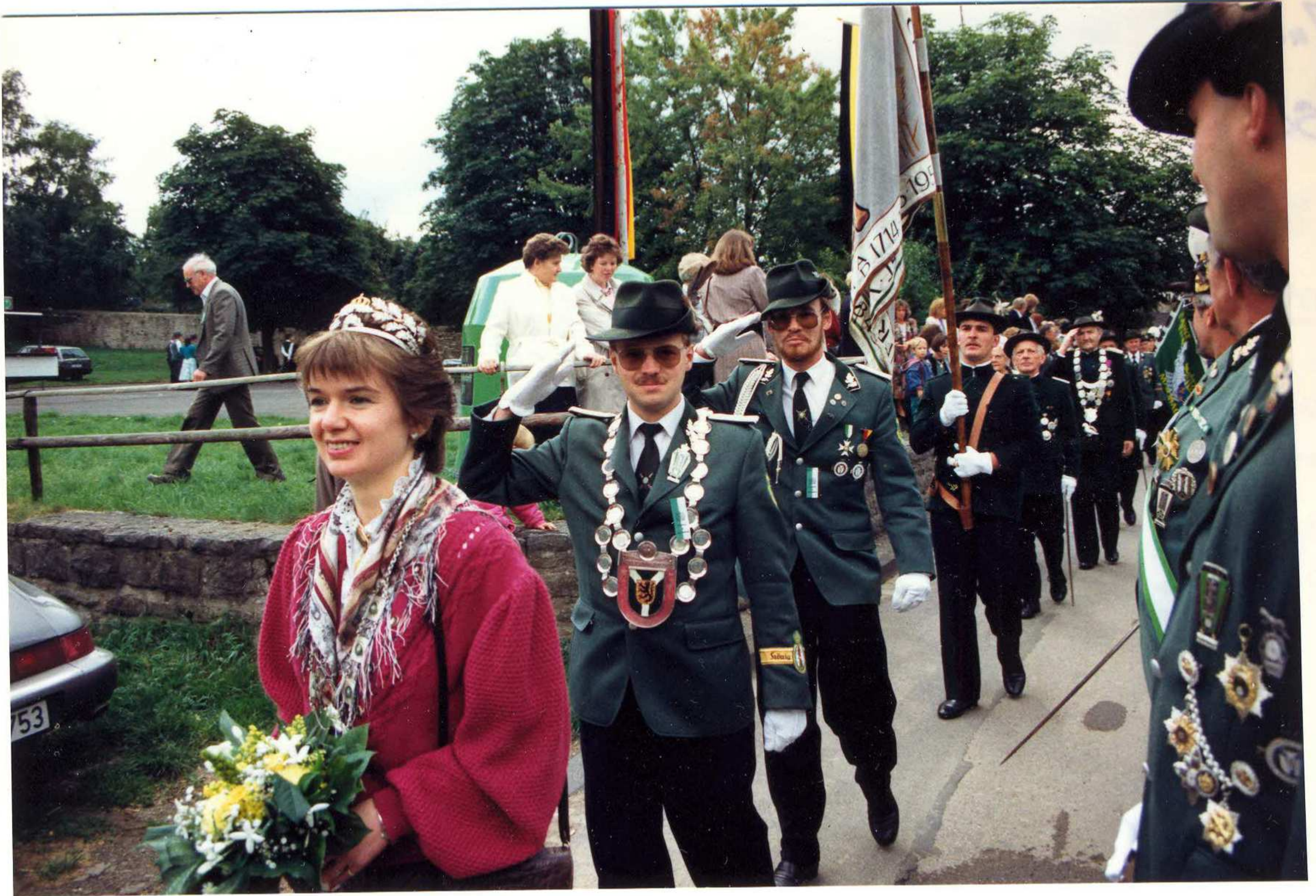
Gemünder Schützenkönigspaar 1989/90 beim Schützenfest 1989 der Bruderschaft St. Hubertus-Wendelinus Rohr-Lindweiler am 3. Sept. 1989