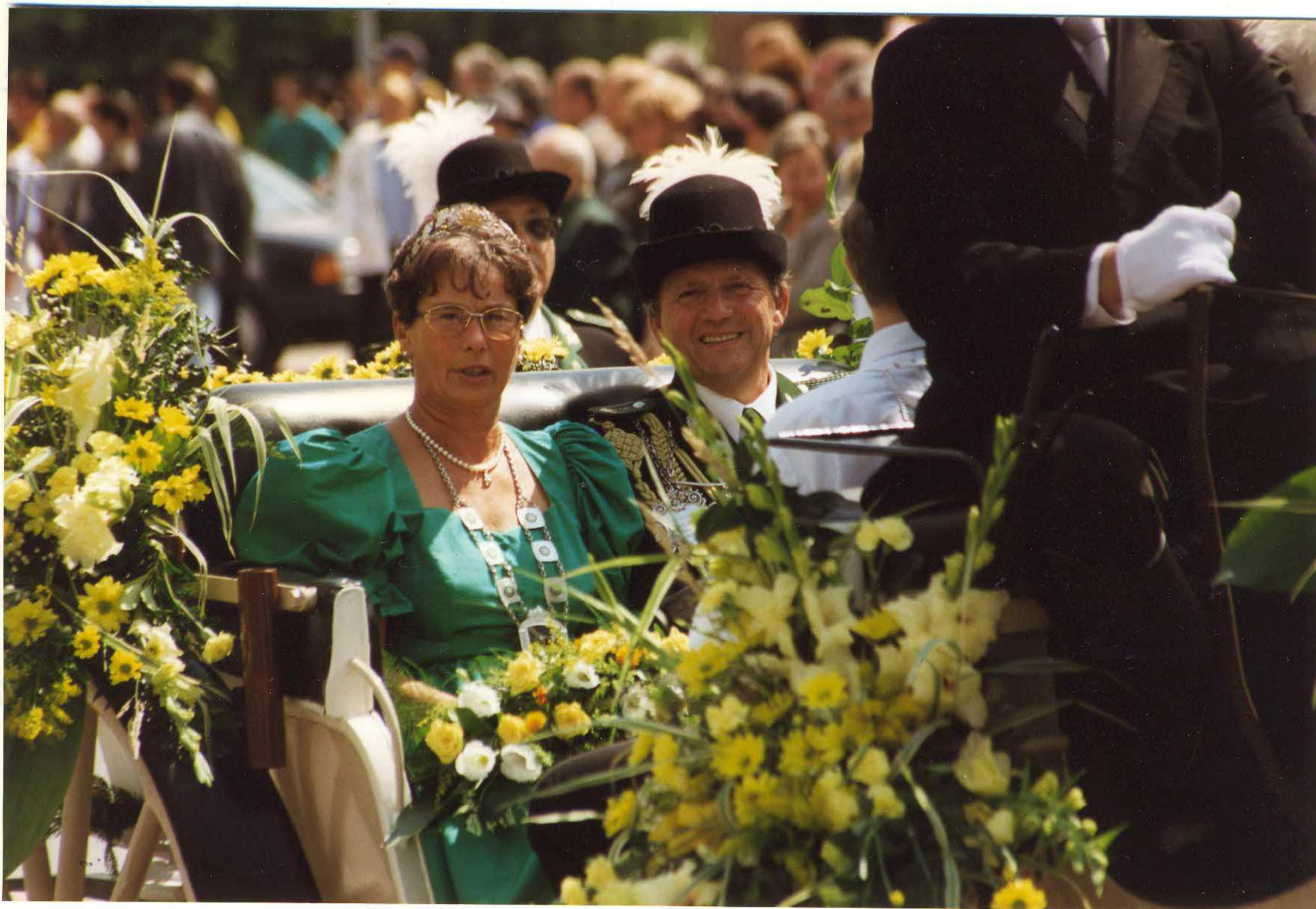
Schützenkönigspar 1996/97 Gemünd - Festzug 20.7. 97 - Zum Abschluß des Königsjahres Umzug durch die Stadt